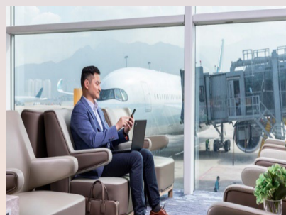
香港环亚机场贵宾室免费体验