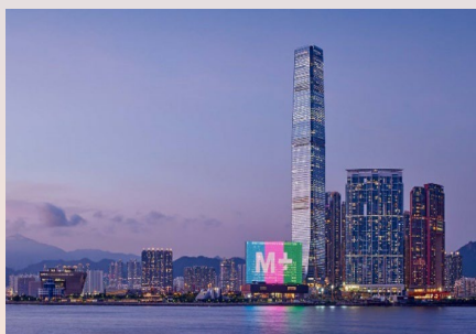
免费M+博物馆一天入场门票

参观香港贸易发展局在十一月假香港会议展览中心举行的香港贸发局香港国际美酒展2023，从一系列专属体验中选择一项礼遇：