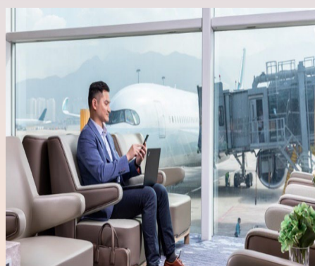
香港環亞機場貴賓室免費體驗