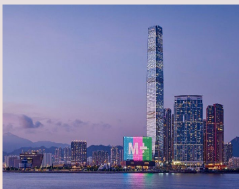
免費M+博物館一天入場門票

參觀香港貿易發展局在十一月假香港會議展覽中心舉行的香港貿發局香港國際美酒展2023，從一系列專屬體驗中選擇一項禮遇：